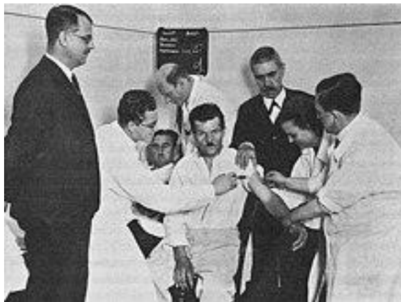
Julius Wagner-Jauregg med handen på en patient som får en malariainjektion 1934.